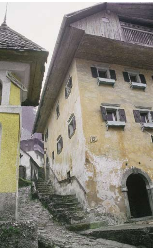
Pibrovčeva hiša v Kropi pred obnovo