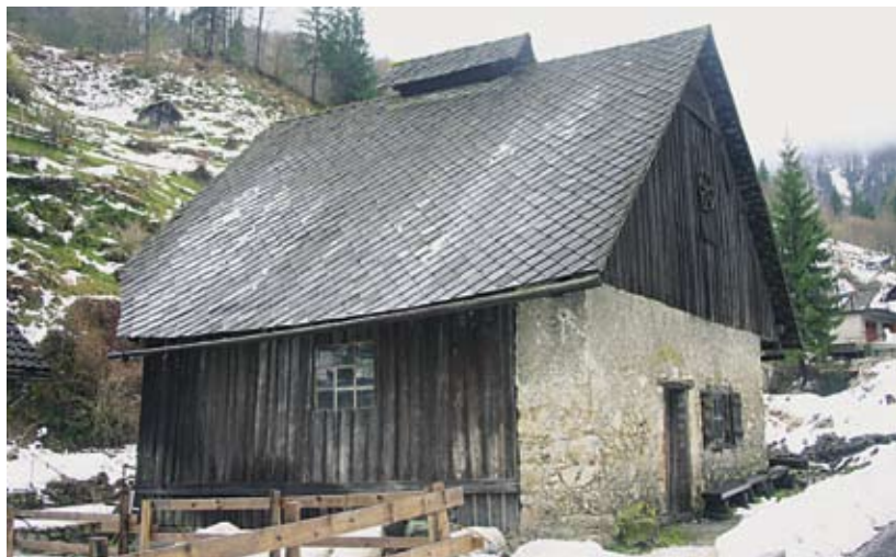
Muzejsko ohranjen vigenjc Vice v Kropi